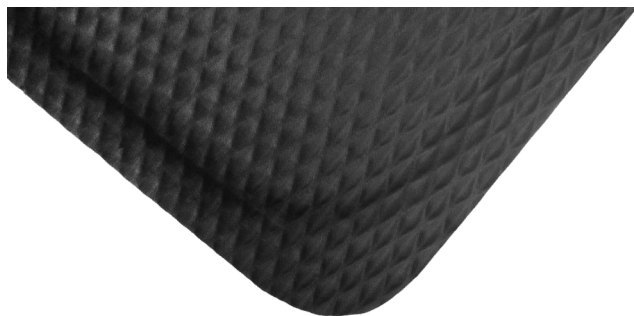
Hog Heaven avec bordure noire

Peut être personnalisé avec votre logo, votre design ou votre message (voir Impressions de Hog Heaven)